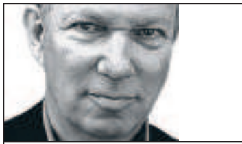
IAN BURUMA is auteur van Murder in Amsterdam: the Death of Theo van Gogh and the Limits of Tolerance . Hij is professor democratie, mensenrechten en journalistiek aan Bard College. Zijn jongste boek is The China Lover .

In een lange brief heeft paus Benedictus XVI deze week zijn beslissing toegelicht over de opheffing van de excommunicatie van vier integristische bisschoppen van de Priesterbroederschap Pius X. De paus gaf toe een vergissing te hebben begaan en wees op het belang van 'informatie zoeken op internet' om zulke misstappen in de toekomst te voorkomen. Ian Buruma vraagt zich intussen af hoe we het best omgaan met uitlatingen als die van bisschop Williamson en brengt ze in verband met de standpunten van de Nederlandse politicus Geert Wilders: 'Laat ze spreken, zodat ze beoordeeld kunnen worden.'