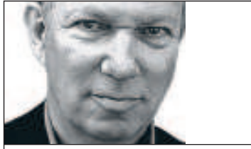
IAN BURUMA is auteur van Murder in Amsterdam: the Death of Theo van Gogh and the Limits of Tolerance . Hij is professor democratie, mensenrechten en journalistiek aan Bard College. Zijn jongste boek is The China Lover .

In een lange brief heeft paus Benedictus XVI deze week zijn beslissing toegelicht over de opheffing van de excommunicatie van vier integristische bisschoppen van de Priesterbroederschap Pius X. De paus gaf toe een vergissing te hebben begaan en wees op het belang van 'informatie zoeken op internet' om zulke misstappen in de toekomst te voorkomen. Ian Buruma vraagt zich intussen af hoe we het best omgaan met uitlatingen als die van bisschop Williamson en brengt ze in verband met de standpunten van de Nederlandse politicus Geert Wilders: 'Laat ze spreken, zodat ze beoordeeld kunnen worden.'